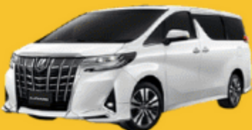
Alphard (2-4 ท่าน)