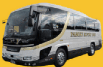
Bus (10-20 ท่าน)

➔ สำหรับท่านที่ต้องการความเป็นส่วนตัวมากขึ้น ท่านสามารถเลือกใช้บริการ รถส่วนตัวได้โดยมีรูปแบบรถให้เลือกถึง 3 ประเภท โดยรถ แต่ละประเภทสามารถนั่งได้ตั้งแต่ 2 ท่านขึ้นไป