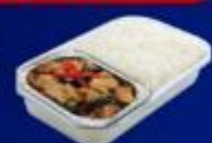
ข้าวทะเลเผาไฟ