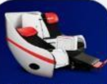
ที่นั่งพรีเมียมแฟลตเบด

บริการอาหารร้อน และ น้ำดื่ม บนเครื่อง ขาไป และ ขากลับ