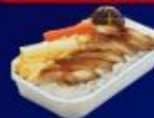
ข้าวหน้าไก่ย่างเกาหลี

บริการอาหารร้อน และ น้ำดื่ม บนเครื่อง ขาไป และ ขากลับ