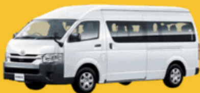
VAN (2-8 ท่าน)