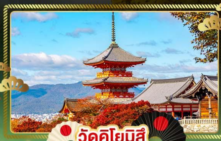
📍 วัดคิโยมิสึ