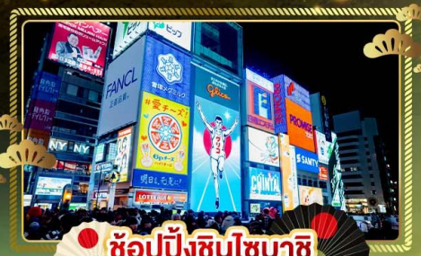
📍 ช้อปปิ้งชินไซบาชิ