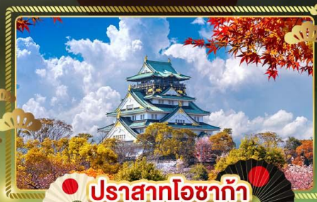
📍 ปราสาทโอซาก้า