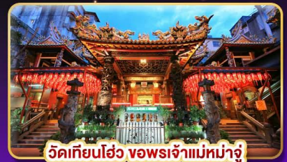
วัดเทียนโหว่ ของพระเจ้าแม่มาจู้